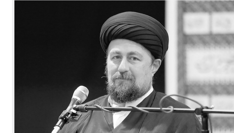
سید حسن خمینی، دبیرکل سازمان ملل متحد اعلام کرد که ایران به تحریم‌های تسلیحاتی بر سر راه است.

مطم رهبری در سال‌های اخیر در این مسأله مهم از خود نشان داده اسند ایجاد می‌کند که همه توجه کنند باید این بحث‌ها را کنار بگذارند تا شرایط بسیار خطیری که می‌تواند نتایج بسیار خوبی داشته باشد، به خوبی بگذرد. شرایط خاصی در دنیا پدید آمده است و این شاء، الله می‌تواند آستان حوادث خوبی باشد. یادگار امام گفت: باید هر جا که هستیم بحث‌های اختلافی را کنار بگذاریم؛ به خصوص اگر تبعید می‌دانم کسی چنین طمعی کند، چون می‌دانسد نتایج تلخی برایشان دارد. امیدوارم بتوانیم از این شرایط نتایج خوبی را بهره‌برداری کنیم.