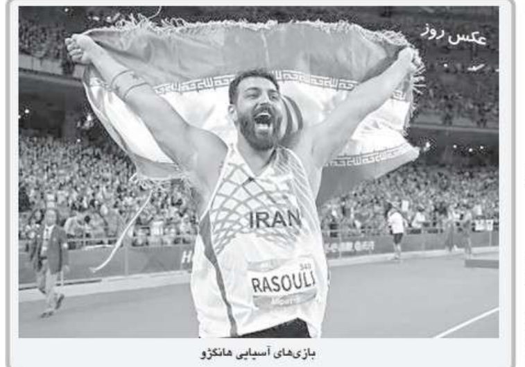
عکس روز: بازی‌های آسیایی هانگژو